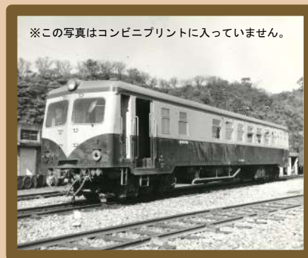
昭和36年、キハユニ16型、郵便貨物車両