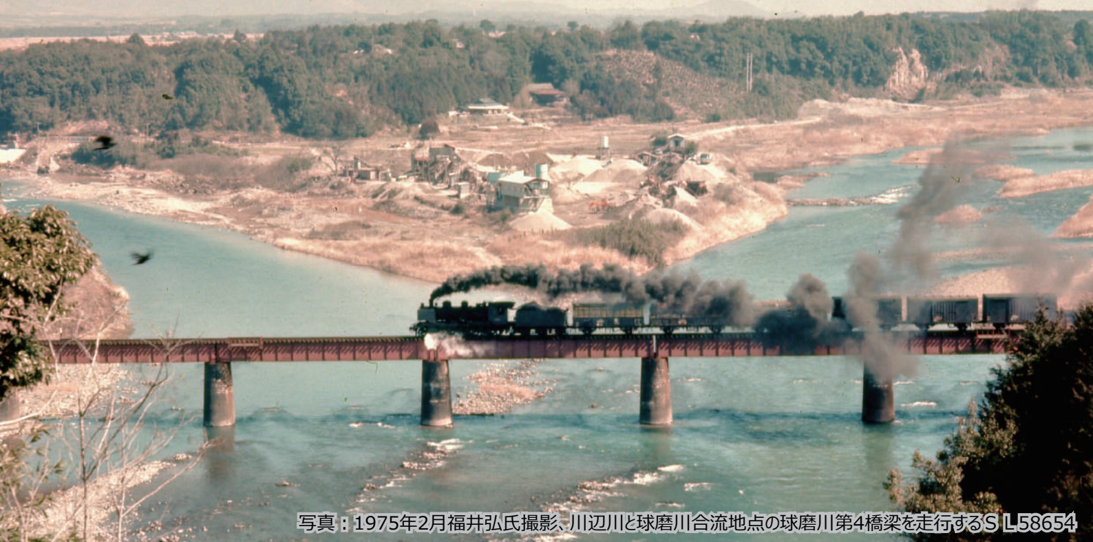
写真：1975年2月福井弘氏撮影、川辺川と球磨川合流地点の球磨川第4橋梁を走行するS L58654

人吉球磨の産業や、公共交通、観光を支えてきた湯前線100年の軌跡をご紹介します。