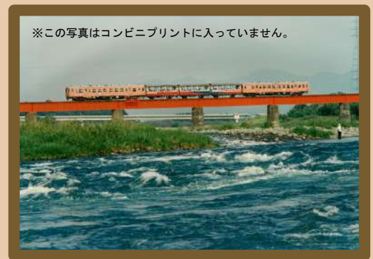
平成元年9月さよなら湯前線トロッコ列車運行